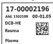
Figur 2. Eksempel på etiketter til fraktionsrør.

Ved indregistrering af blodfraktionerne printes etiketter, som påsættes de respektive fraktionsrør. Se eksempel i figur 2.